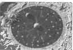
Horoscop 10-16 august: Mercur îndeamnă la prudență, Soarele aduce entuziasm