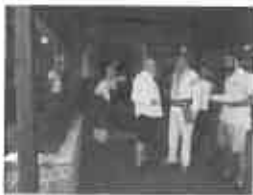
a testat turismul din Neamț în pantaloni scurți