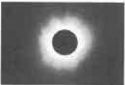
Horoscop 17-23 august: Sub semnul eclipsei de Soare